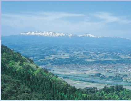
焼石岳～東稲山からの眺望