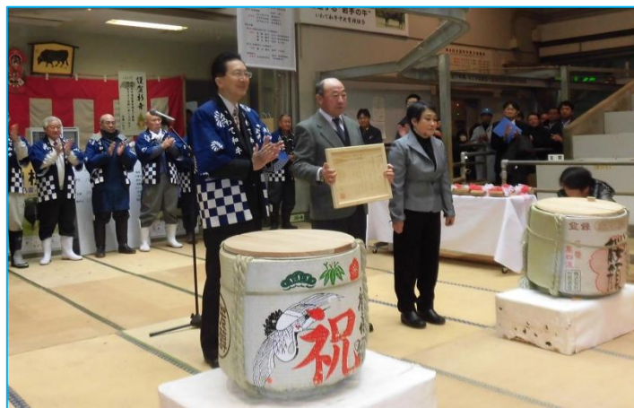
写真1 功労賞授与式 達増知事より授与