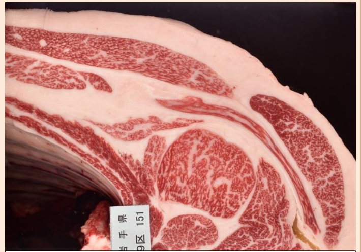
⑧花安勝 枝重 490kg 口芯 59 cm 2 BMSNo. 7

両区とも、枝肉成績はほぼ全ての形質で前大会より向上していましたが、他道府県の出品牛がこれを上回る結果となり優等賞入賞はなりませんでした。