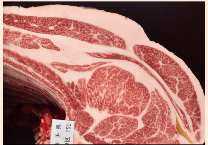
⑦山根雲 枝重 490.5kg 口芯 68 cm 2 BMSNo. 7