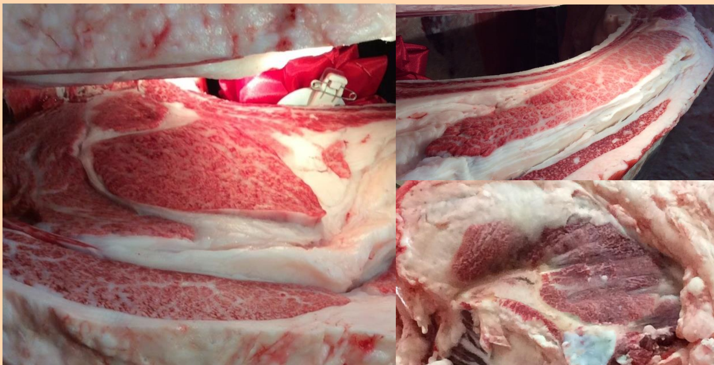
○枝肉写真：雫石町 中屋敷氏 提供