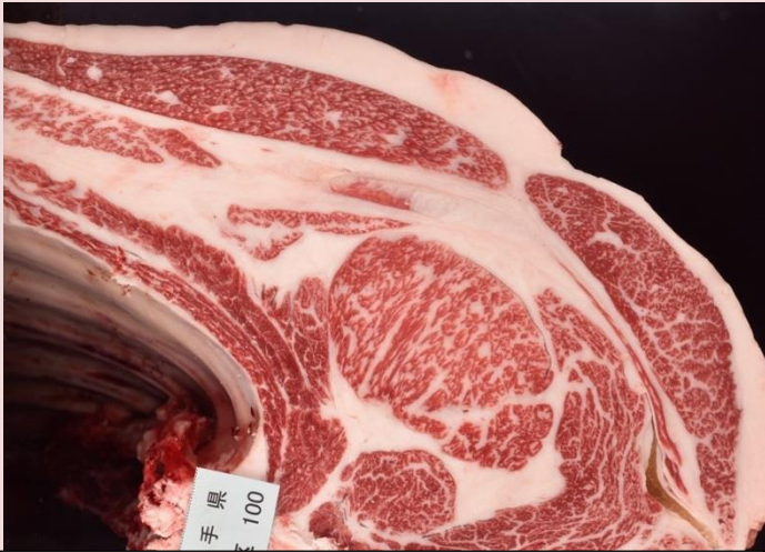
④平成舞鶴 枝重 453kg 口芯 76 cm 2 BMSNo. 7