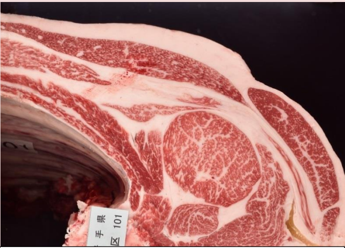
⑤平成舞鶴 枝重 458kg 口芯 71 cm 2 BMSNo. 6