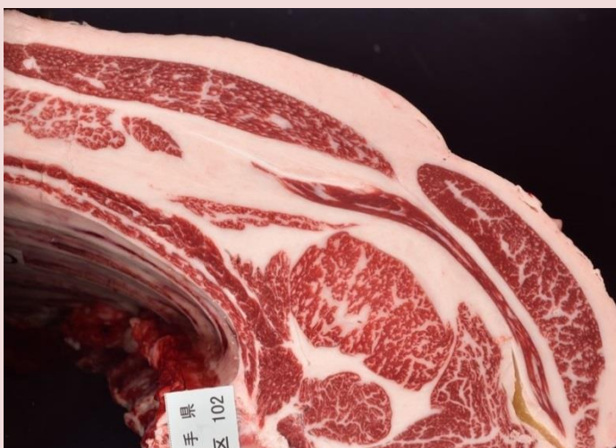
⑥平成舞鶴 枝重 439kg 口芯 51 cm 2 BMSNo. 4