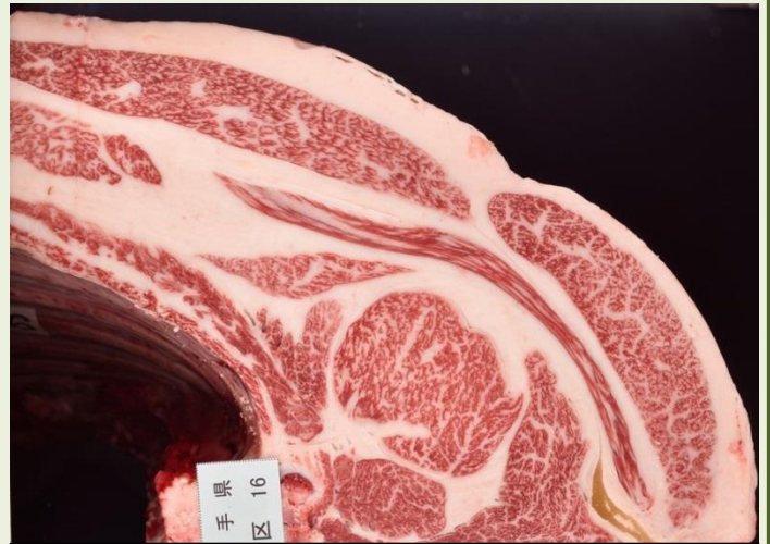
①花安勝 枝重 485.5kg 口芯 52 cm 2 BMSNo. 8

前大会に比較し、本大会ではロース芯面積、バラの厚さ、皮下脂肪の厚さ、歩留、BMS No. で大きく上回っており、入賞した上位6県の平均と比較しても、遜色ないレベルでしたが、枝肉重量とMUFA 予測値が下回り、次回鹿児島大会へ向けての課題となりました。