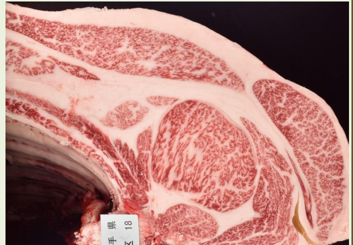
③花安勝 枝重 467.5kg 口芯 87 cm 2 BMSNo. 11