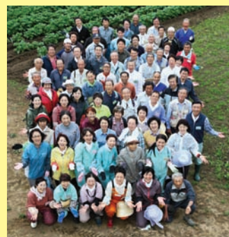
■表紙写真 平成24年度「いわて農業入門塾」 受講生の皆さん

岩手県立農業大学校農業研修センターが実施する平成24年度「いわて農業入門塾」は、90名の方々を受講しており、5月5日から10月20日までの毎週土曜日の全25回、ハウス6a、露地115aのほ場で約40品目の野菜を栽培しています。