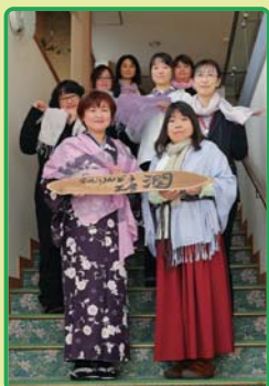
■表紙写真 「安代りんどう工房 潤(じゅん)」の皆さん

安代りんどう工房 潤は八幡平市安代地区でりんどう染めに取り組んでいる、生産者7名のグループです。 日本一のりんどう産地「安代りんどう」の新たな魅力発信、規格外品の有効活用、農閑期の収入アップをめざし、活動しています。 工房の皆さんが身につけている、ストールなど小物類のりんどう染めや販売のほか、染めもの体験の受け入れなどにも取り組んでいます。 商品の詳細は、農業普及1月号の自慢の逸品コーナーをご覧ください。