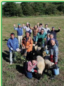
■表紙写真 下大桑ヒツジ飼育者の会のみなさん