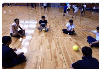
その場で (ボール2個)