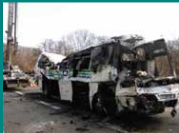
軽井沢 スキーバス事故