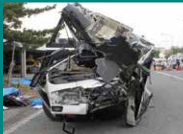
関越道高速 ツアーバス事故

重大な事故を起こした貸切バス会社はいずれも下限額を下回る運賃で運行を行っていました。