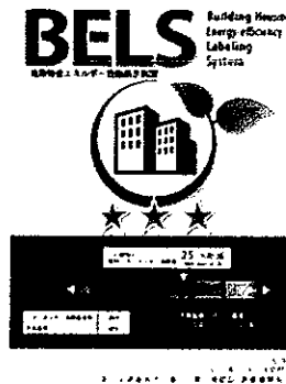
[図1] ガイドラインに基づく第三者認証の例

また、ダイヤモンドリスponsに対応した時間帯別・季節別の電気料金メニューが選択できる場合はその活用に努めるとともに、エネルギー管理システム（BEMS・HEMS等）の導入により、ビルの運用方法、住宅の住まい方の改善によるピーク対策及び省エネルギーに努めること。