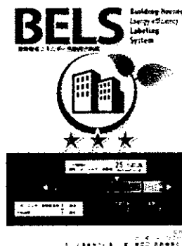
〔図1〕 ガイドラインに基づく第三者認証の例

また、デマンドリスポンスに対応した時間帯別・季節別の電気料金メニューが選択できる場合はその活用に努めるとともに、エネルギー管理システム（BEMS・HEMS等）の導入により、ビルの運用方法、住宅の住まい方の改善によるピーク対策及び省エネルギーに努めること。