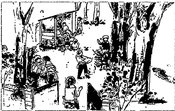
第28回 国土交通大臣賞、学園町ちやい藤・ガーデンプロジェクト