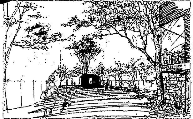
第28回 国土交通大臣賞、社会福祉法人 みらいみらいおもいけ園

地域のシンボリックな緑地として人と自然が共生する都市環境の形成、地域の活性化に寄与するプランを募集します。