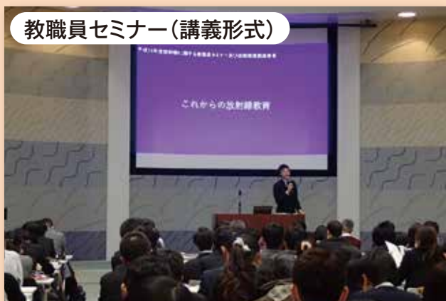
教職員セミナー（講義形式）