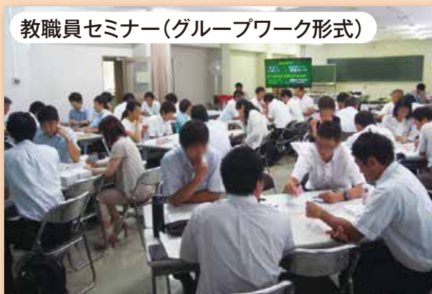
教職員セミナー（グループワーク形式）