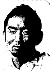
為末 大 氏

2001年・2005年世界陸上大会男子400mハードル銅メダリストの為末大氏を特別講師に招き、鳥取方式の芝生の上で行うかけっこ教室の様子を視察します。