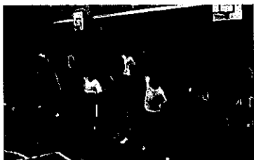
神奈川県立横浜ひなたやま支援学校