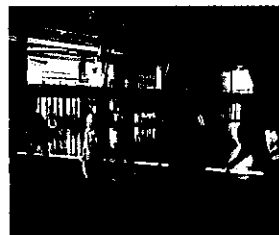
『現代的なリズムのダンス研修』 新潟市立総合教育センター主催