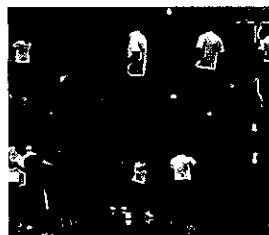
『京都府中学校体育実技ダンス講習会』 京都府教育庁主催