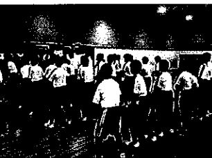
東京都品川区立小中一貫校品川学園

※ご予算や内容は学校様の規定や地域のご状況などによって柔軟に対応させていただきます。大変ご好評いただいております。特に夏休みや春休み期間については研修が集中しますので、お早めに日程のご相談をいただければ幸いです。