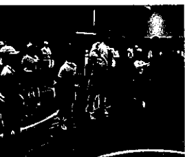
石川県白山市立松陽小学校