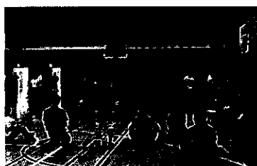
『全国学校体育指導者実技講習会』 東京都立中学校保健体育科研究会主催