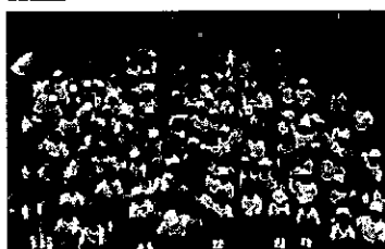
東京都目黒区立駒場小学校

保育園・幼稚園・小学校・中学校・高校などへ訪問し、生徒様へダンス指導を行います。 実際の授業の進め方や評価、子どもたちへの声掛け、作品創り などを含め、経験豊富なJDAC講師が担当致します。内容も学校様とお打合せをさせていただきますので、お気軽にご相談下さい。※下記実施例（一部掲載）