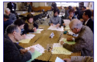
(全体研修会の様子)

充実した地域ぐるみの取組にするため組織を再構築しました。幹事会(教委、学校、PTA)を組織し推進にあたり、地域の様々な団体に参加を呼びかけ全体研修会等を実施しました。