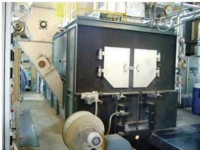
バイオマスボイラー1号機