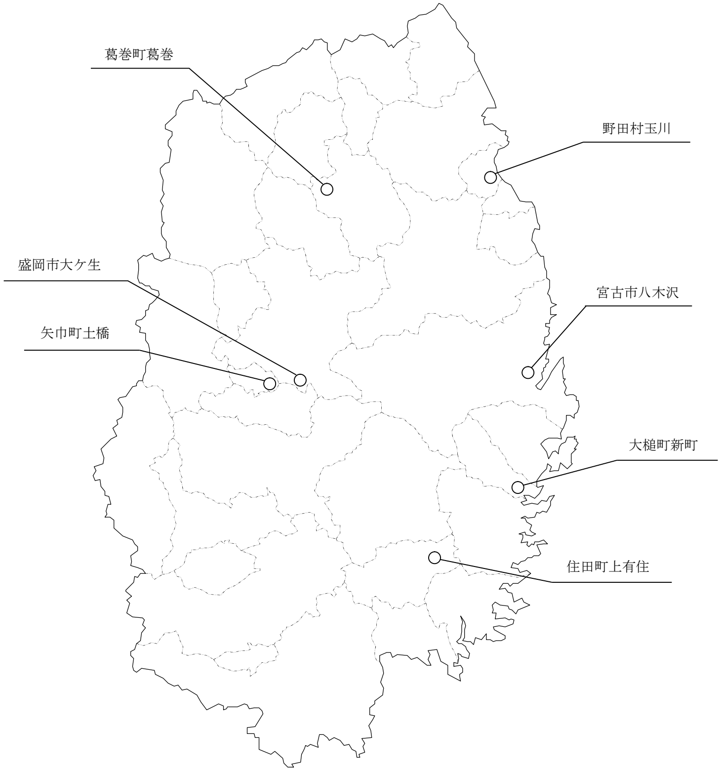
図3 令和2年度ダイオキシン類（地下水）モニタリング調査地点