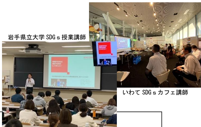
岩手県立大学 SDGs 授業講師