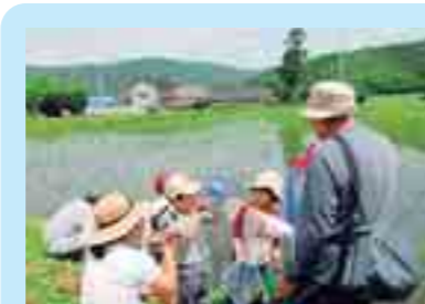
土淵町での田んぼの生き物調査 (遠野市)