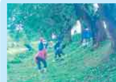
豊沢川での河川美化活動 (花巻市)