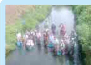
吸川での体験学習 (一関市)