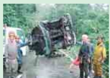
奥羽山系の焼石連峰周辺でのごみ の撤去活動 (奥州市)