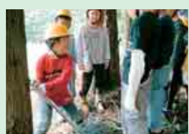
小黒石地区での間伐等の林業体験 (奥州市)