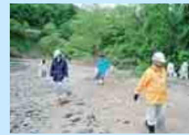
和賀川での河川バトロール (北上市)