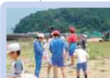
田谷浜での海岸清掃活動 (陸前高田市)