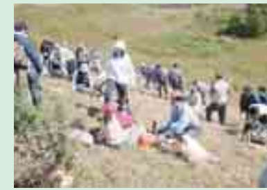
松尾鉱山跡地での森の再生活動 (八幡平市)