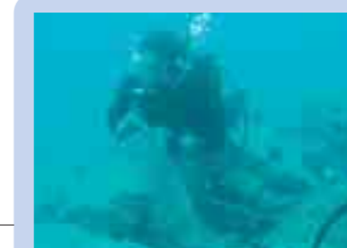
崎浜漁港でのボランティアによる 海底清掃活動 (大船渡市)