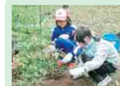
重茂地区での閉伊川上流・下流連 携による植樹活動 (宮古市)