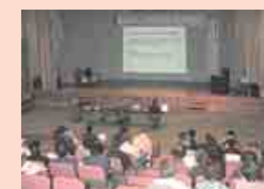
けせん環境フォーラム

各流域 (地域) で行われている活動が一層活発化し、全県に広が っていくよう、岩手県と環境学習交流センターでは、取組み事例の情報 提供や協働の場づくりなどを通して、環境保全活動を支援します。