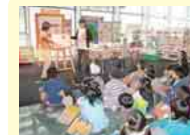
環境学習交流センター (盛岡市)