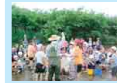
久慈川での水辺観察会 (久慈市)