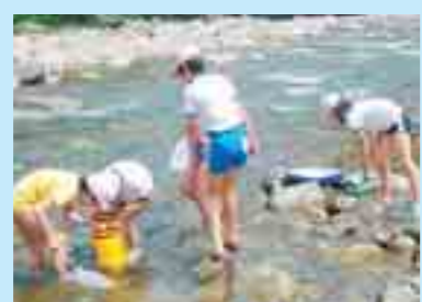
南本内川での水生生物調査 (西和賀町)