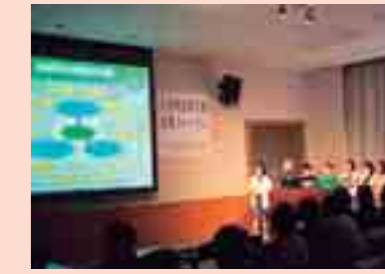
久慈地区森川海連携フォーラム

各地域で活動発表や意見交換など を通して、活動団体相互の交流が 図られています。