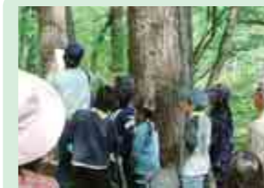
平庭高原での森林教室 (久慈市)