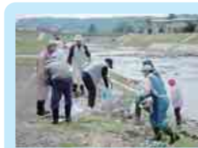
雪谷川での清掃活動 (軽米町)