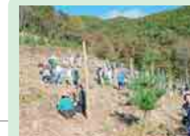
唐丹地区での植樹活動 (釜石市)