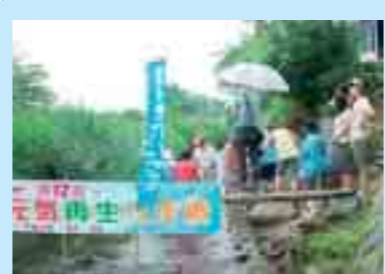
千厩川での水生生物調査 (一関市)