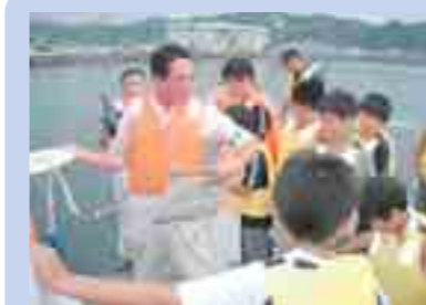
宮古湾での環境調査 (宮古市)