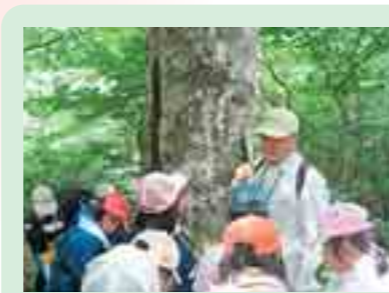
折爪岳での森林散策 (二戸市)