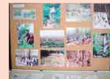
県南流域交流フォーラム