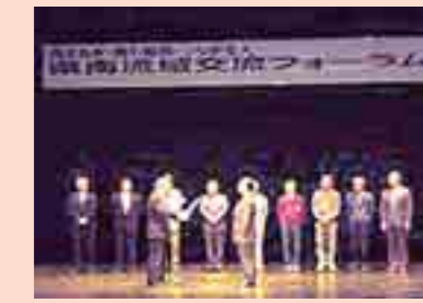
久慈地区森川海連携フォーラム