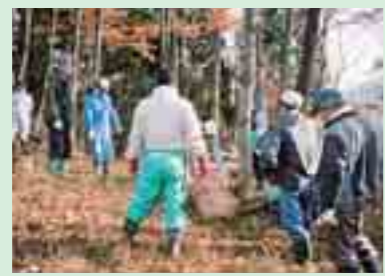
大巻地区での森の整備 (紫波町)