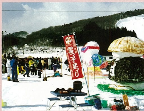
●夏油高原水神雪っ子まつり