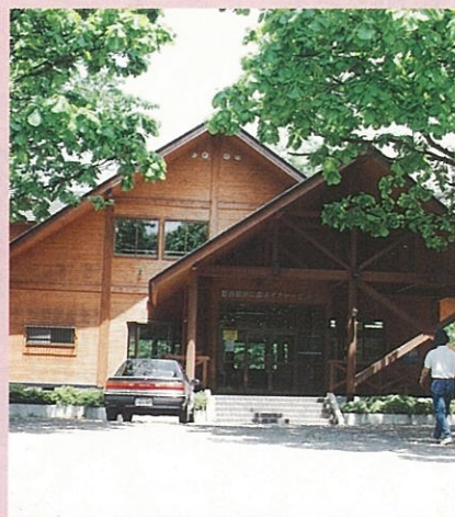
●ネイチャーセンター