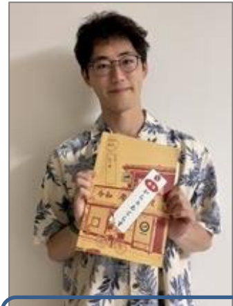
表紙を担当した獣医師 国家試験対策冊子

趣味は絵を描くことで、建物や動物の絵をよく描いています。自然が豊かで、趣のある建物がとても多い岩手県をこれから描いていきたいです。