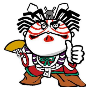
いわて消費者トラブル防止啓発キャラクター