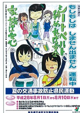
夏の運動ポスター