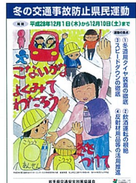
冬の運動ポスター