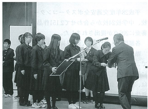
テレビCMコンテストグランプリの盛岡第二高等学校