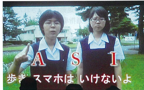
平成28年度「正しい交通ルールを守る運動県民大会」(10月26日 盛岡グランドホテル)