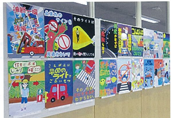
展示の様子（9/17～25、マリオス）

県審査に提出された205作品は、9月17日から25日まで、盛岡駅西口のマリオス展望室展示場（20階フロア）に展示いたしました。また、各部門の最優秀賞については、県民大会の席上で表彰するとともに、大会会場に入賞作品を展示し、大会参加者に御覧いただきました。