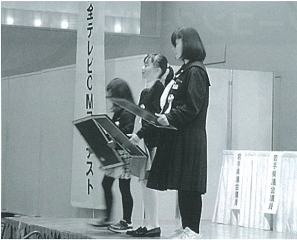
ポスターコンクール最優秀賞の表彰