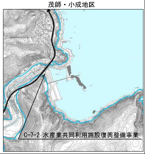
C-7-2 水産業共同利用施設復興整備事業