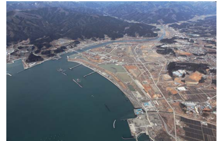
上空から見た公園予定地（平成 27 年 3 月 岩手県撮影）