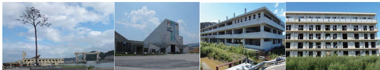
奇跡の一本松 道の駅高田松原 タビック 45 気仙中学校 下宿定住促進住宅