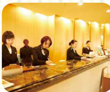
株式会社プラザ企画は、国の「えるばし認定」と「プラチナくるみん認定」を取得したほか、県の「いわて働き方改革AWARD2017最優秀賞」を受賞。

県では、このような優良事例の紹介や助成・支援制度の普及啓発などに取り組み、働き方改革を推進するとともに、正規雇用の拡大などを図っていきます。