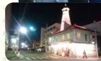
平成28~29年に盛岡市で実施した空き家活用の一例。紺屋町番屋で開催したイベントの様子。