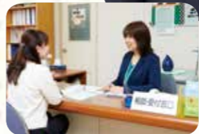
久慈・宮古・釜石・大船渡の被災者相談支援センターでは相談員が対応します。