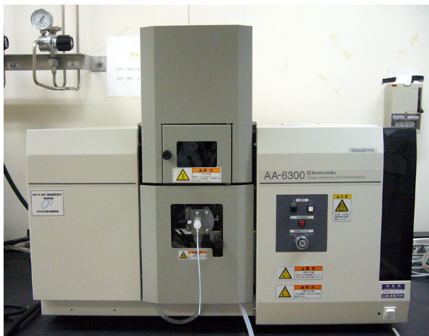
本体(原子吸光分光光度計)