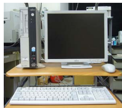
PCセット(コントローラー)