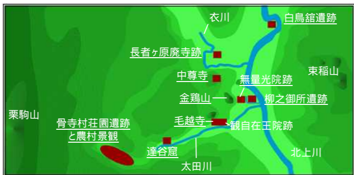
【「平泉の文化遺産」構成資産位置図】

たところ。14世紀の絵図に描かれた中世の農村の基本的な土地利用形態と居住形態を彷彿とさせる農村の良好な文化的景観が現在に継承されています。