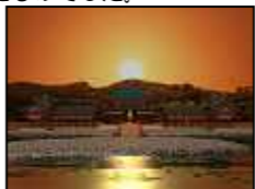
【無量光院の落日(復元CG)】

平泉は、周囲の山や川など変化に富んだ自然地形を活かし、寺院・庭園・政庁などを要所に配置して発展的に形成されました。これは、周囲の自然も浄土の世界を構成する重要な要素と考え、浄土庭園の背景に自然の山を取り入れたり、東稲山に桜を植樹したりするなど、自然環境にも十分配慮されたものでした。