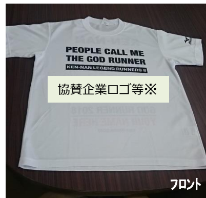
ゴッドランナー賞品Tシャツ ロゴ掲出イメージ