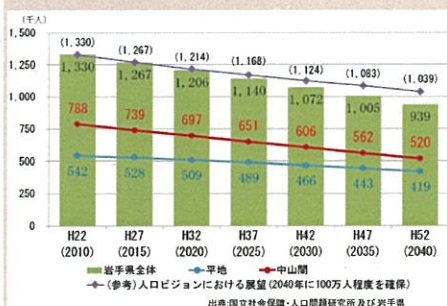
【図1】岩手県の将来推計人口