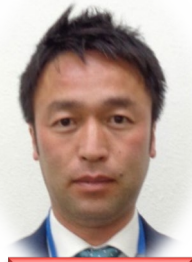
☆指導主事 (宮古市) 藤森崇浩